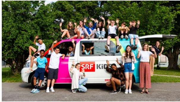
Abbildung 1: SRF school Medienworkshop.